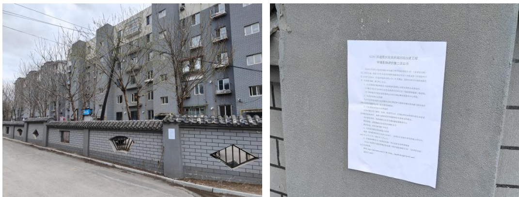
图 5 小区张贴公示

信息公开的第三个载体为在项目所在地附近小区及乡村进行张贴公示，公示时间为2025年4月21日—5月6日，共10个工作日，符合《环境影响评价公众参与办法》中张贴公示持续公开期限不得少于10个工作日的要求。