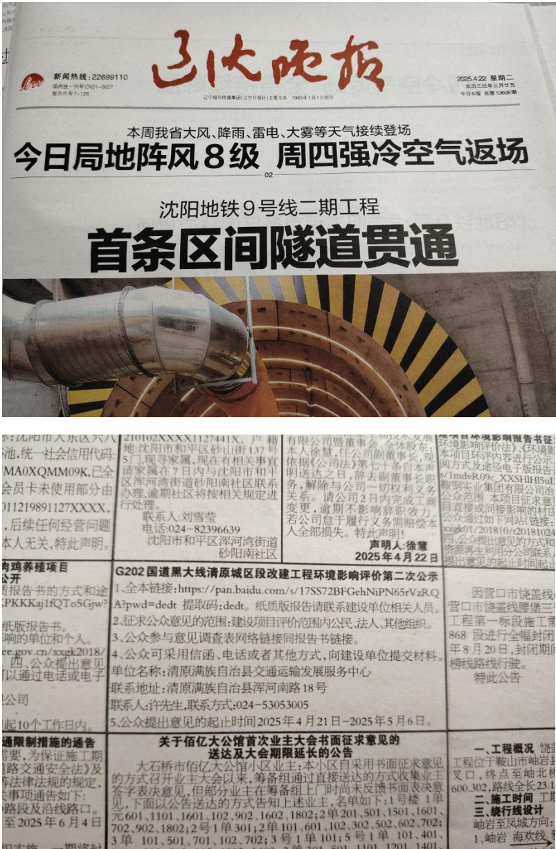
图3 征求意见稿报纸第一次公示

信息公开的第二个载体为辽沈晚报，该报纸为建设单位当地群众最为广泛接触的报纸之一，符合便于公众熟知的载体要求。公示报纸日期为2025年4月22日、2025年4月23日，共计2次，符合《环境影响评价公众参与办法》中在征求意见的10个工作日内公开信息不得少于2次。