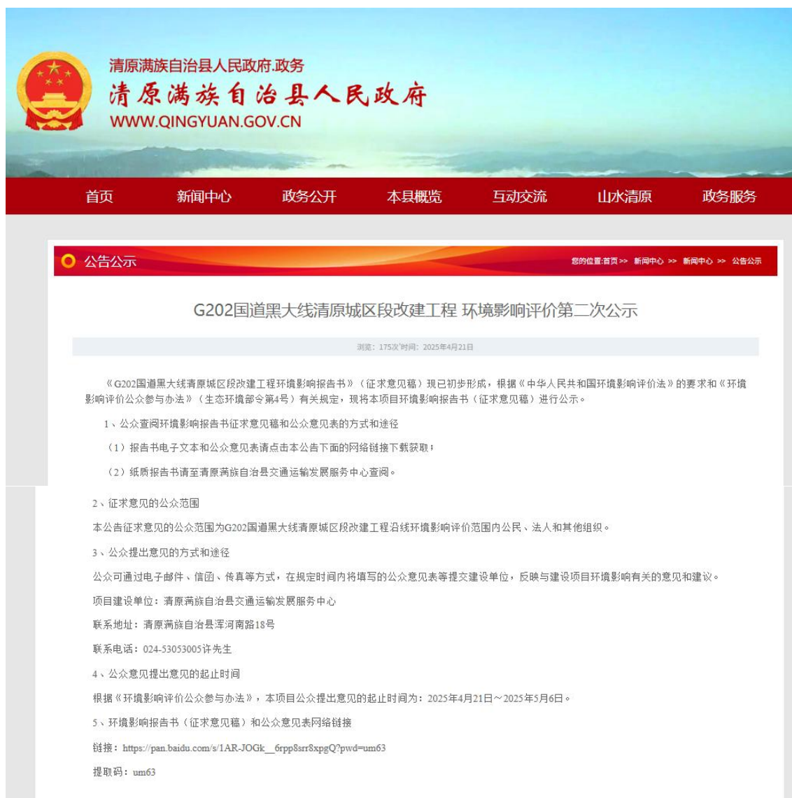
图2 第二次公示截图

本项目征求意见稿公示时间为2025年4月，开展项目环境影响报告书征求意见稿公示。公示的主要内容有环境影响报告书征求意见稿全文的网络链接及查阅纸质报告书的方式和途径；征求意见的公众范围；公众意见表的网络链接；公众提出意见的方式和途径；公众提出意见的起止时间；公示的期限及内容，符合《环境影响评价公众参与办法》第十条规定。