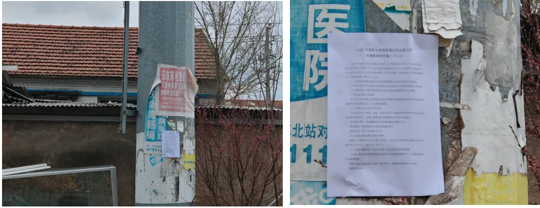
图 8 乡村张贴公示