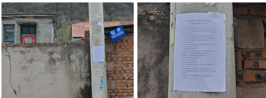
图 7 乡村张贴公示