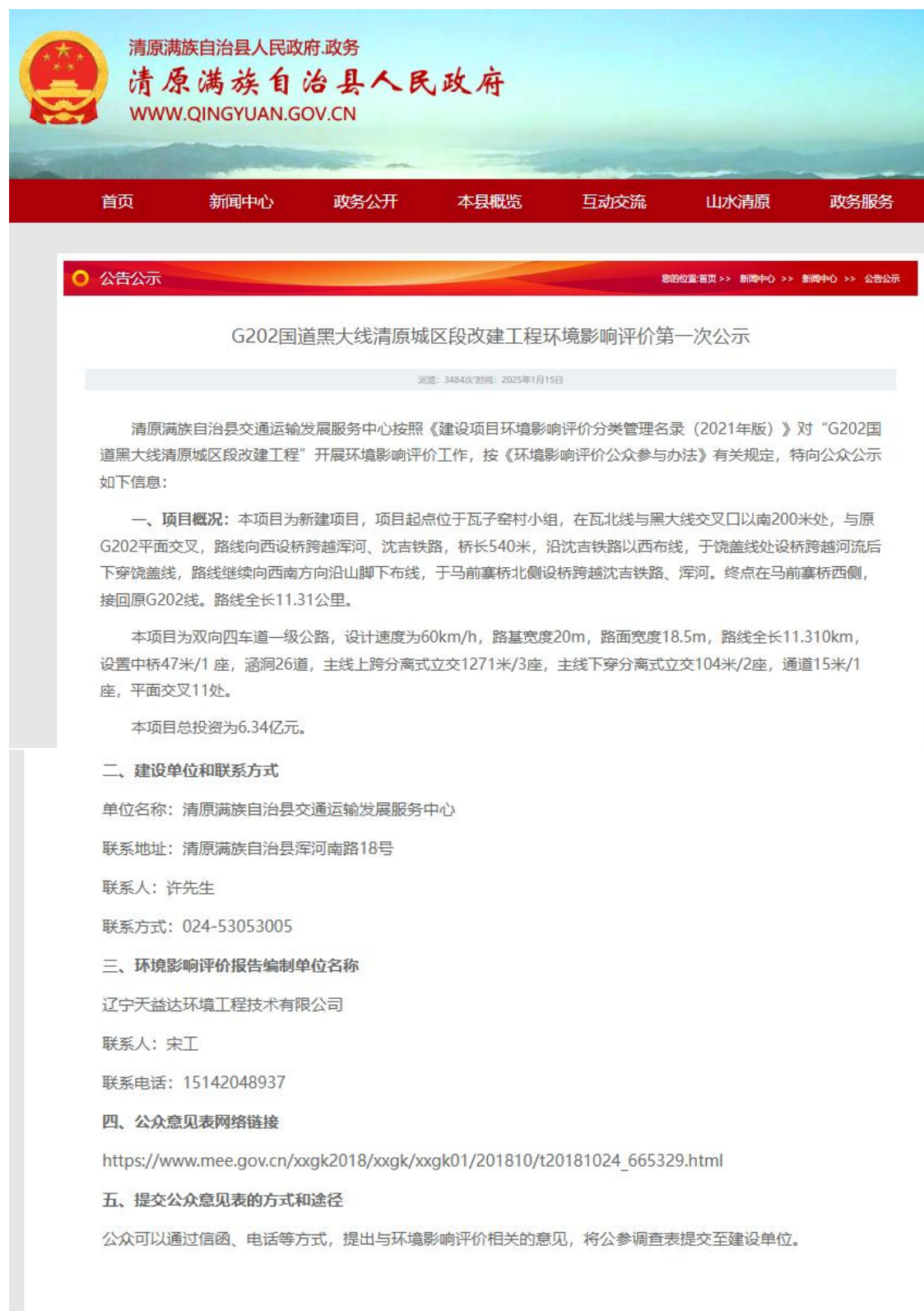
图1 第一次公示截图