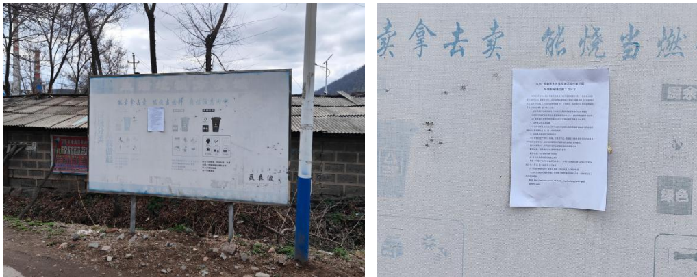
图 9 乡村张贴公示