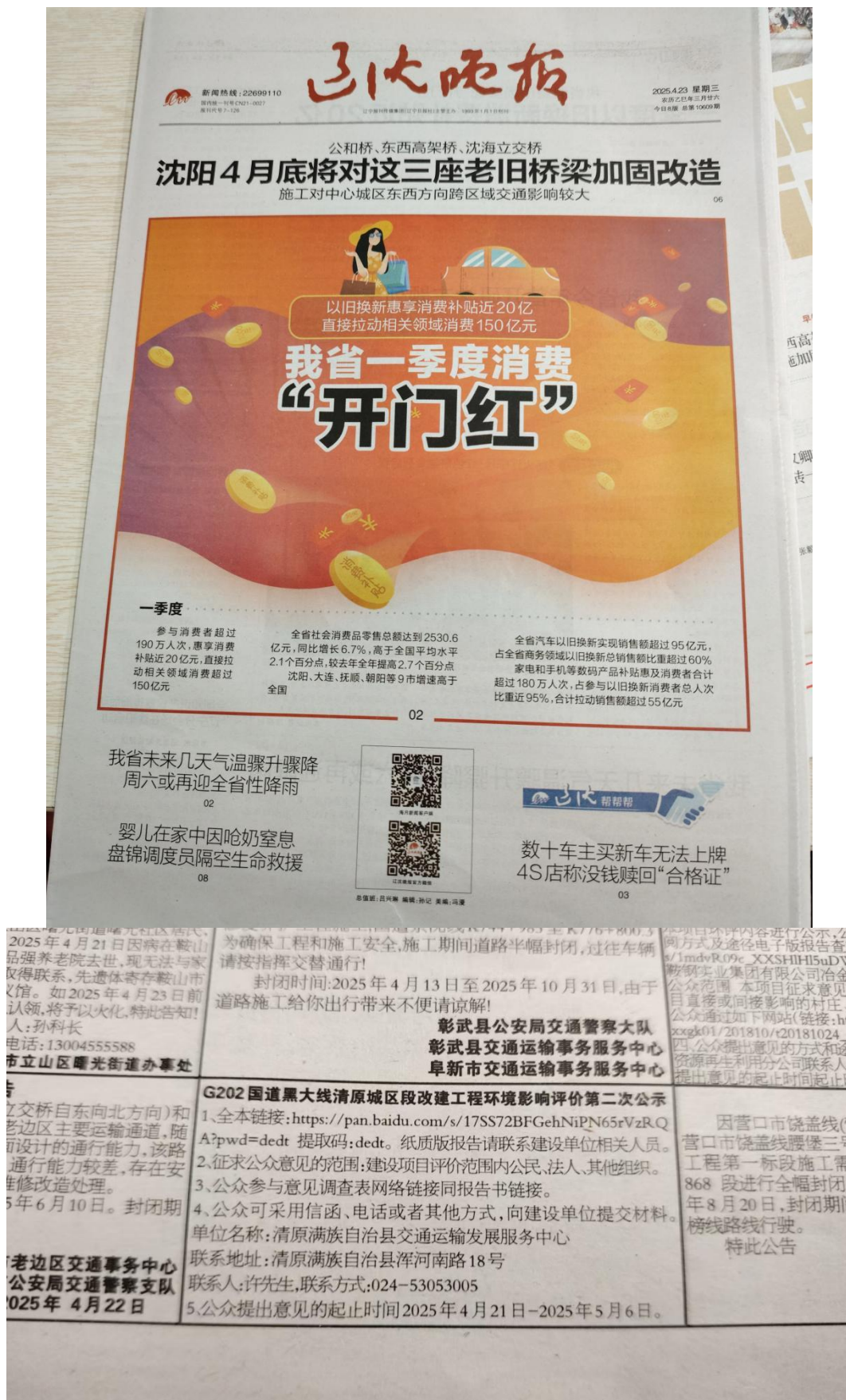
图4 征求意见稿报纸第二次公示