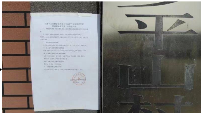
萝卜坎村村民委员会