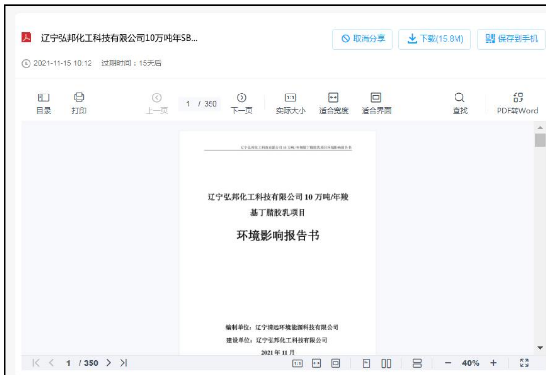
图 2 征求意见稿公示内容图

本项目征求意见稿公示时间为 2021 年 11 月 16 日—11 月 30 日，共 10 个工作日，与《环境影响评价公众参与办法》（生态环境部令第 4 号）相关符合性分析见下表。