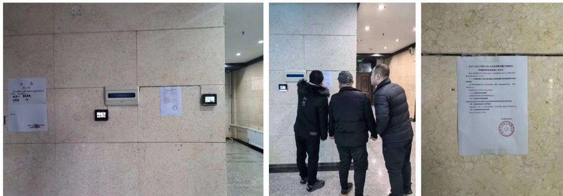
图 3.2-4 园区管委会张贴公告截图

我公司于 2023 年 12 月 7 日在园区管委会、台沟村及萝卜坎村公示栏张贴了本项目征求意见见诸公示材料，公示截图见图 3.2-4 至图 3.2-6。