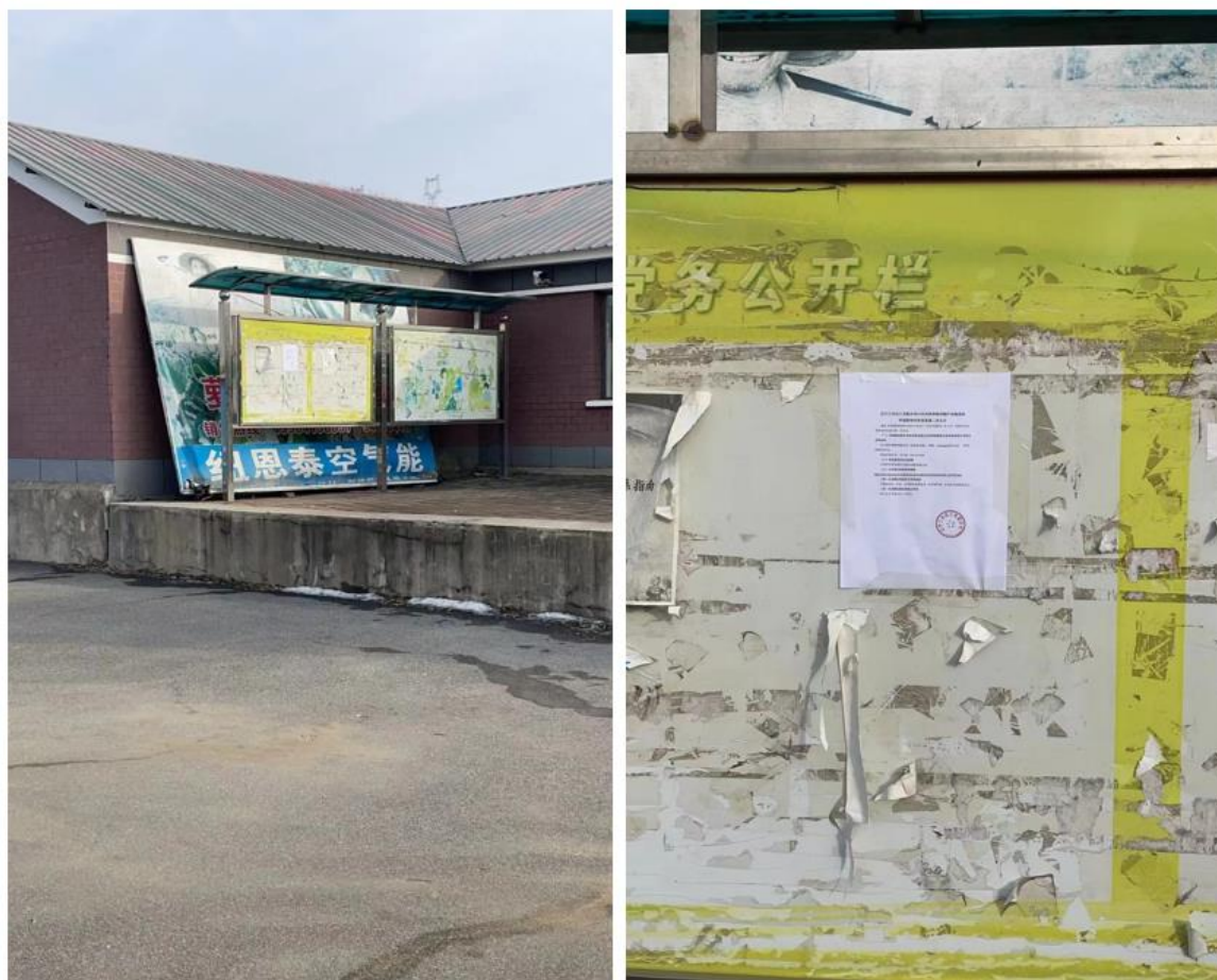
图 3.2-6 萝卜坎村张贴公告截图