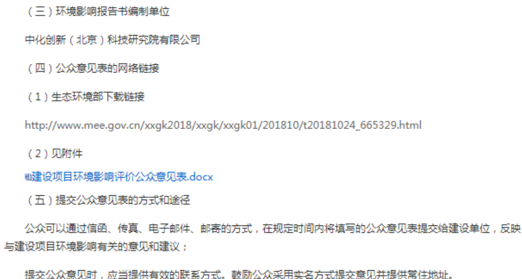
图 2.2-1 首次环境影响评价信息公开公示截图